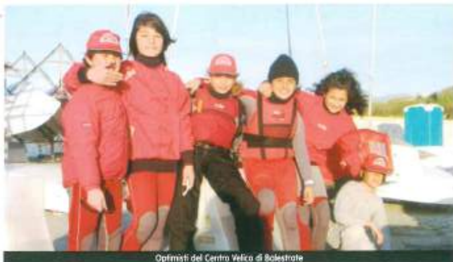
Optimisti del Circo Velico di Balestrate

Il presente regolamento che, sostituisce i precedenti, entrerà in vigore dalla stagione agonistica 2010.