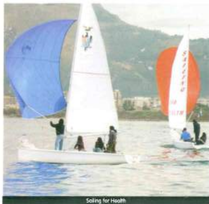
Sailing for Health