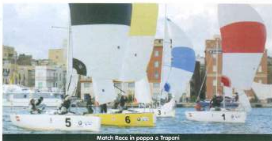
Match Race in pappà e Trapani