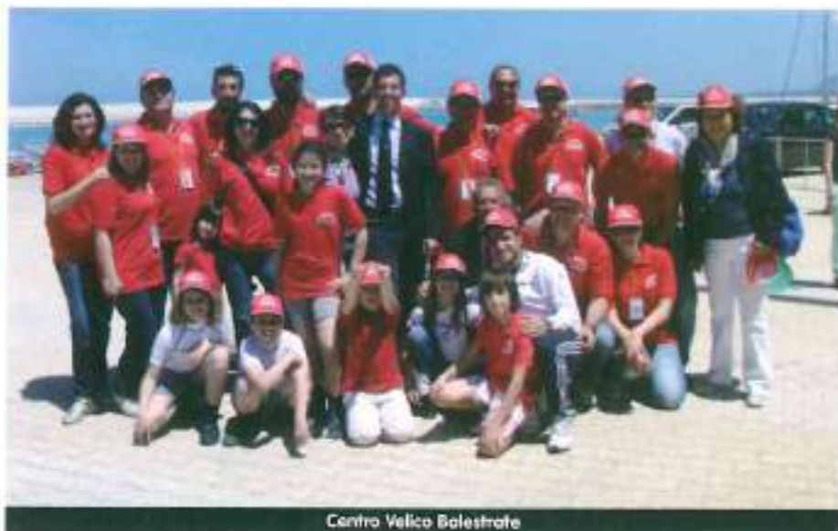
Centro Velico Balestrate