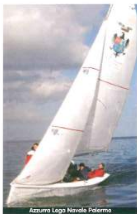
Azzurra Lega Navale Palermo