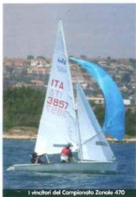
I vincitori del Campionato Zonale 470