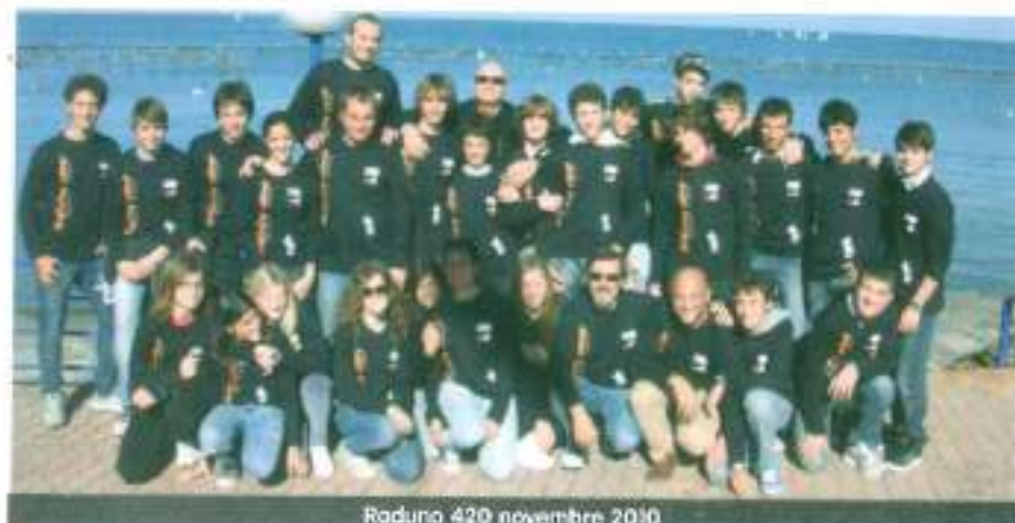
Raduno 420 novembre 2010

R.N. n. 447 VIA DANTE, 44 - 90141 PALERMO (PA) Tel. 091 322136/322300 - Cell. 3443003221 Fax 091453488 - alfredobarbera@costapomerite.it