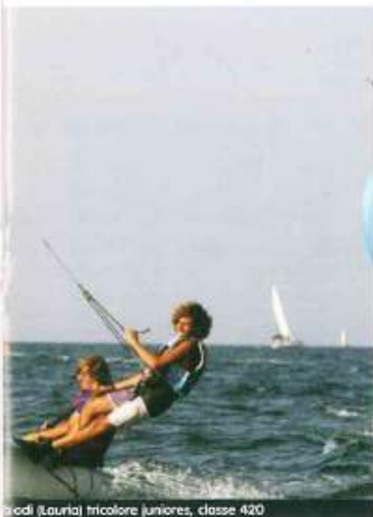
Chiodi (Lauria) tricolore juniores, classe 420