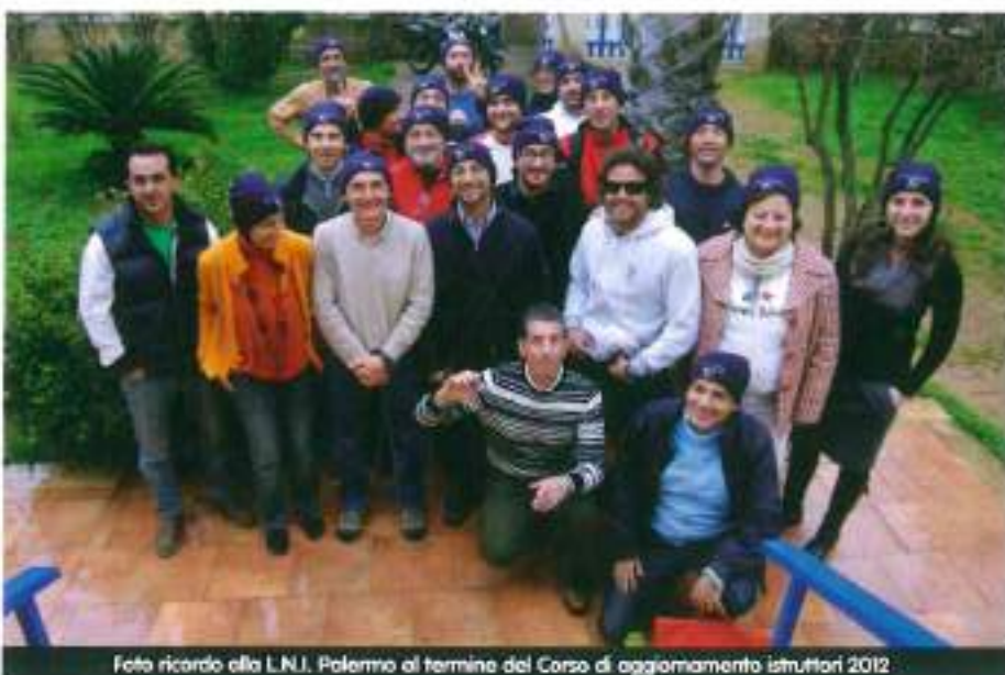
Foto ricordo alla L.N.I. Palermo al termine del Corso di aggiornamento istruttori 2012