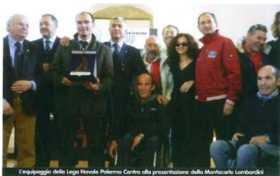
L'equipaggio della Lega Navale Palermo Centro alla presentazione della Montecarlo Lombardini