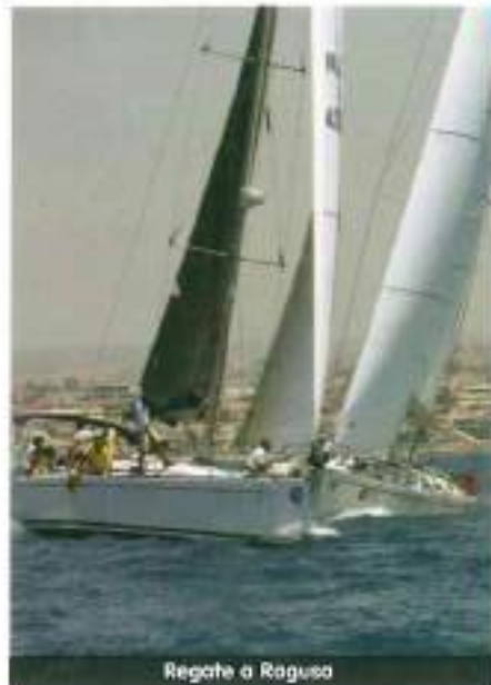
Regate a Ragusa

672 - ASSOCIAZ. E MOTONAUTICA E VELICA PELORTANA ASD VIA CASE BASSE - 98168 VILLAGGIO PARADISO NE Tel./Fax 090 359787