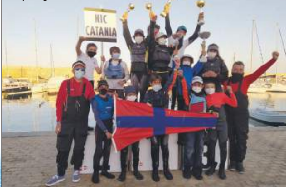
La squadra giovanile del NIC Catania - Foto ricordo

VIA TOMMASO AIELLO, 7 - 90011 BAGHERIA (PA) Cell. 328 6195671 gaetano.verri@hotmail.it