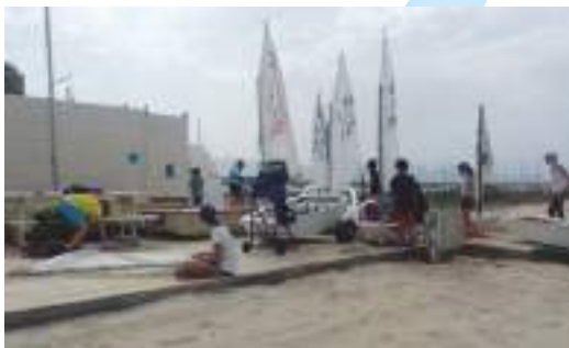
I ragazzi del Centro Velico Balestrate armano i loro Optimist, nella sede del circolo

Consigliere Nazionale Via S.G. Bosco, 88 - 91025 MARSALA Cell. 3356294866 ernestosalvomartinez@gmail.com